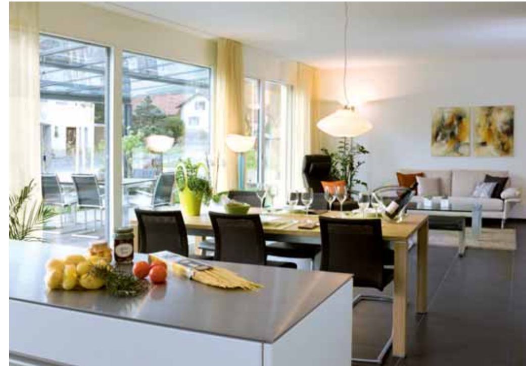
Küche und Wohnraum sind offen gestaltet. Zum dunklen Plattenboden wählte Trudi Leuener eine moderne Küchenfront in Weiss mit Arbeitsflächen aus Chromstahl – eine Herausforderung für den Küchenbauer, da die Bauherrin den Chromstahl in die Küchenmöbel versenkt haben wollte. Die lange Fensterfront lässt viel Licht ins Rauminnere und bietet direkten Zugang zu Garten, Pool und Sitzplatz.