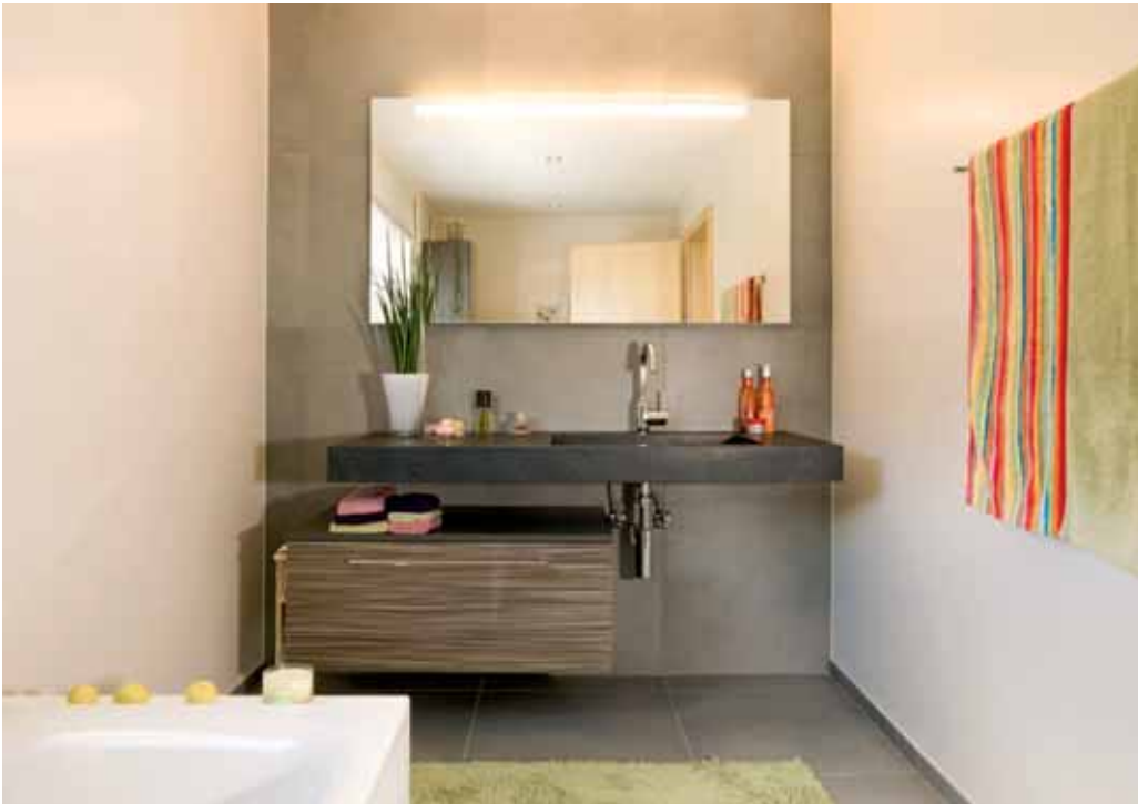
Im zweiten Geschoss befinden sich die beiden Badezimmer: Für die Hausherrin mit Badewanne, für den Hausherrn mit Dusche. Anstelle der dunklen kommen hier hellgraue Platten zum Einsatz. Das Lavabo ist aus schwarzem Granit. In den beiden Schlafräumen wurde weiss gekalkter Eichenparkett verlegt.

Eichenparkett – ein spannender Kontrast zu den dunklen Steinplatten, die im Flur verlegt sind. Ganz besonders mag die Bauherrin ihr neues kleines Reich: Das Nähzimmer mit Computer und Internetanschluss, wo sich auch Waschmaschine und Trockner befinden, nennt sie ihr «eigenes Refugium».